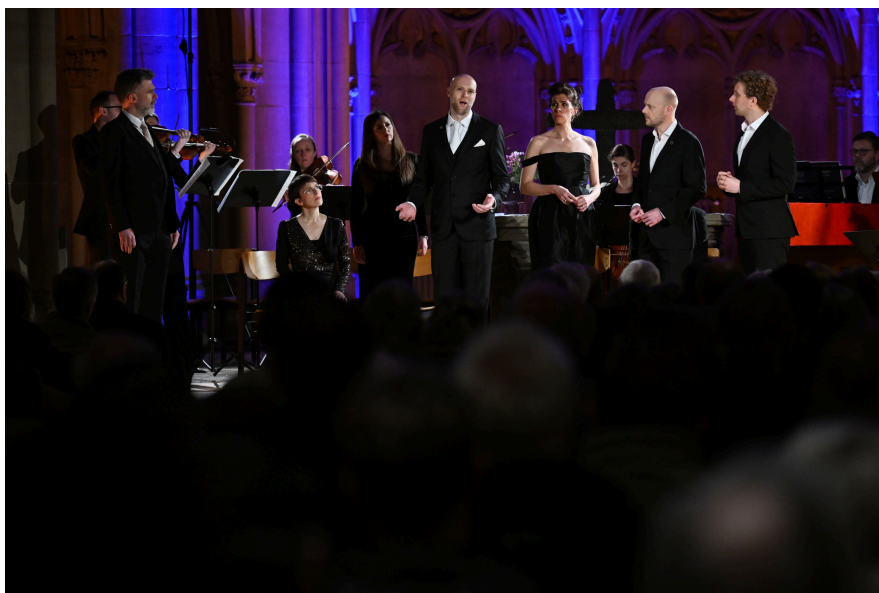
Solomon's Knot

Cette prestation se caractérise par une véritable incarnation des mots énoncés par cœur, confinant quasi à une théâtralisation, et surtout rendant intéressants les récitatifs très nombreux. Le récit commence avec l'épisode au jardin des oliviers et s'achève avec la mise au tombeau. Tous ces interprètes frappent par un engagement, une présence et une concentration sans faille, avec un souci de clarté dans l'énonciation, et constamment l'expressivité requise dans ce style baroque où les mots sont chargés d'un grand poids rhétorique.