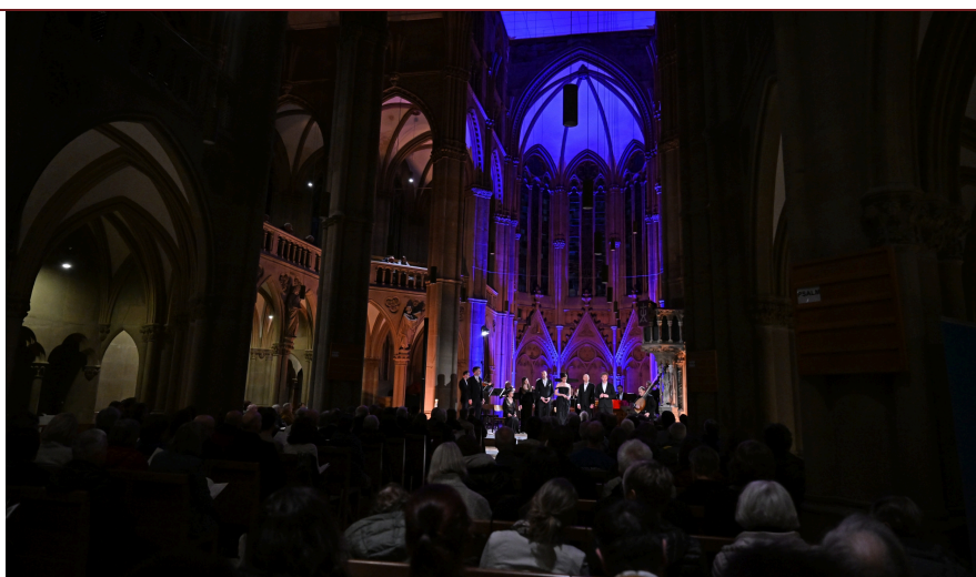
Solomon's Knot

Composé du quatuor de cordes, d'une contrebasse, d'un théorbe, d'un orgue et d'un clavecin pour les instruments, disposés dans le chœur de l'église, ce « Solomon's Knot » comprend aussi huit chanteurs et chanteuses, en deux quatuors, debout en demi cercle devant les musiciens, se déplaçant parfois, selon une forme de dramaturgie, chacune et chacun chantant par cœur les chœurs, les chorals, les récitatifs de maints petits rôles, et les arias.