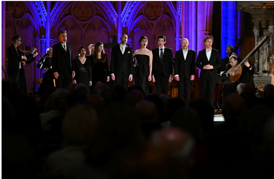
Solomon's Knot

La performance est saluée par l'auditoire avec chaleur dans cette fraîche église.